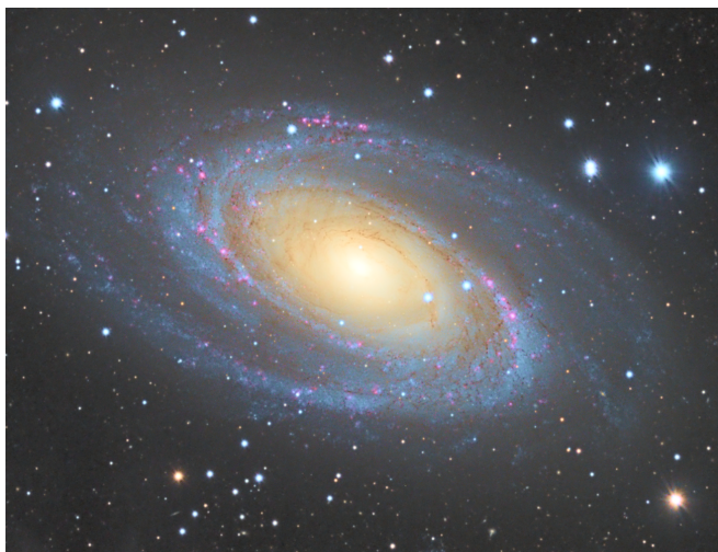
图 2: 波德星系

嗯，反正我们拍星系的时候想看到的肯定不是这样的，星系背后深邃的太空 (见图 2)。如果你用一个同口径焦比更长的镜子，虽然表面亮度降低了，