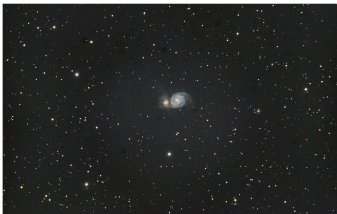
图 3: M51

但这时候我们可以使用像素面积大的相机或者后合并像素去提高效率。与它相比，使用短焦比的镜子要想得到相同的分辨率，就必须找到像素面积很小的芯片，但在整个过程中，每角秒的信噪比还是不变的。换句话说： 拍摄星系我们是要看细节的，使用焦比短的镜子并不会比焦比长的镜子吃亏。